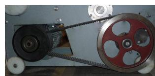
Transmission Variateur de vitesse