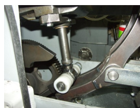
Entrainement Piston Details