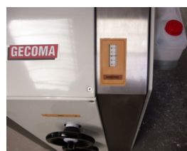
Indice des Poids