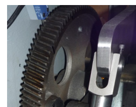
Entrainement Piston Details