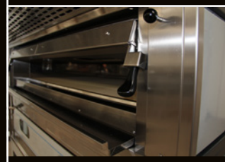
Portes à bascules simples ou doubles