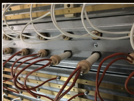
résistances en céramique